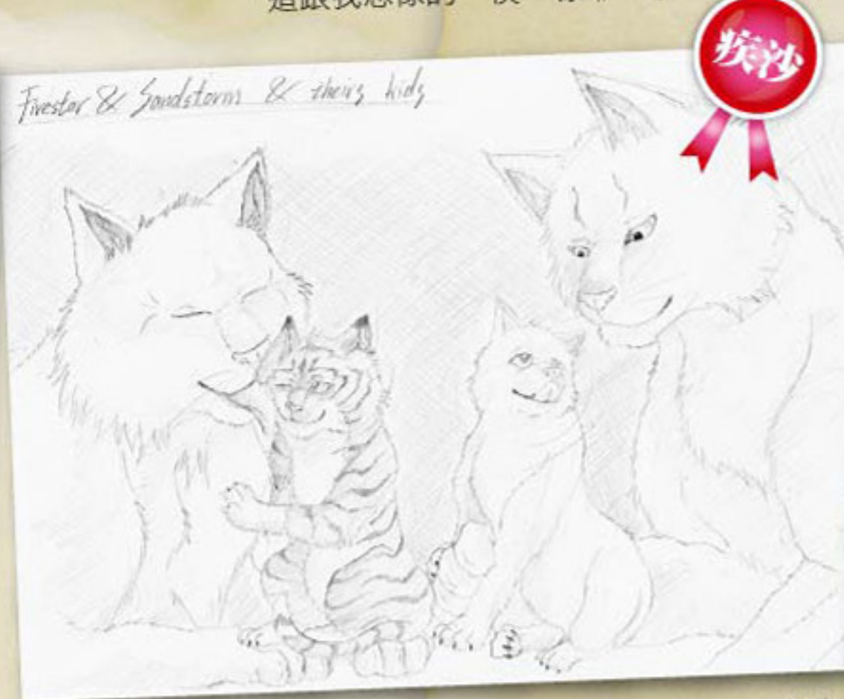
雖然貓戰士小編覺得疾沙畫貓比較像是在畫狼，但是疾沙的黑白素描功力，也忍不住令人刮目相看呢。