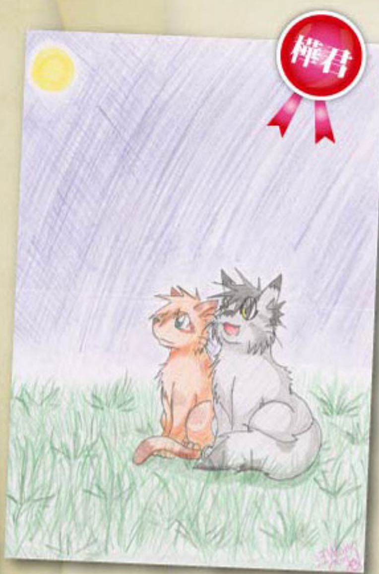
火星與灰紋在月光下聊天的樣子，把兩人好友感情都呈現出來了！