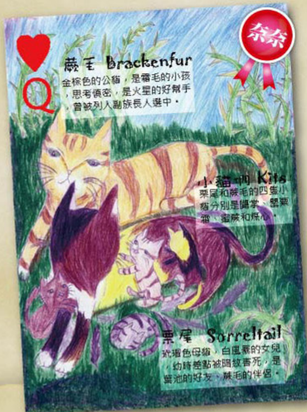
奈奈搶先畫出第12集的情節，將蕨毛與栗尾的小貓畫出來，一家六口有很溫馨的感覺。