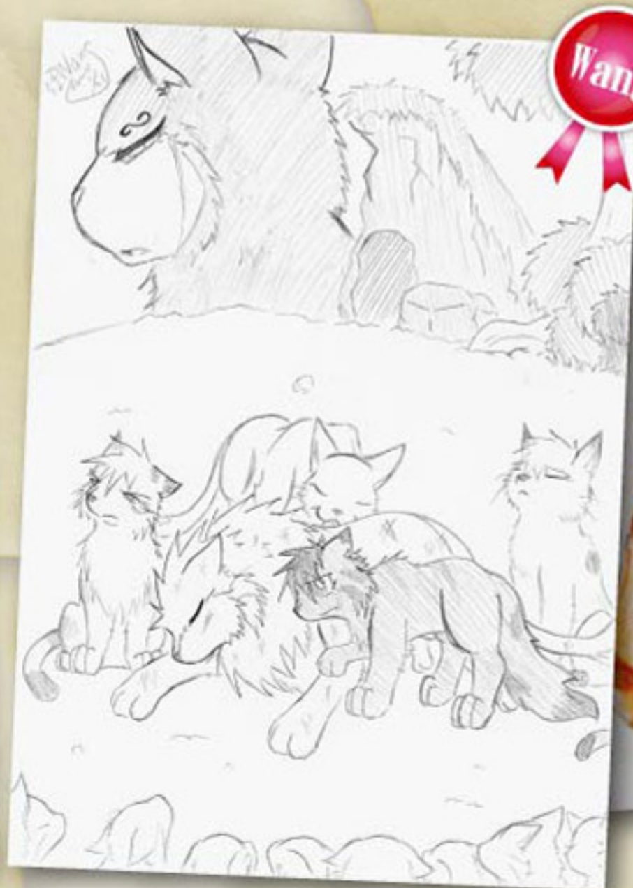
Wang畫出獅心前往星族的路程，想到這段情節，令人忍不住想哭。