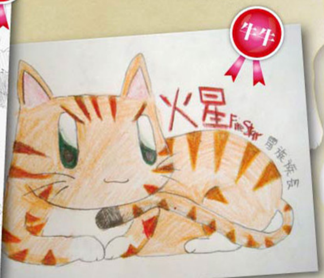
牛牛把火星的眼神畫得非常氣宇軒昂，但是頭和身體非常有寵物貓的感覺。(笑)