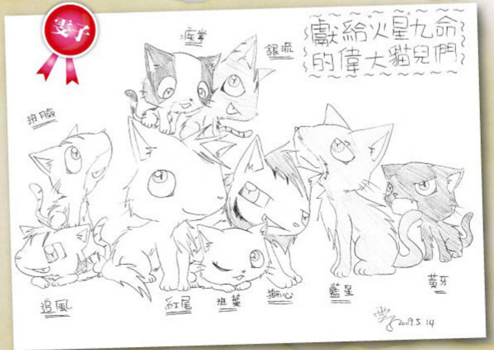
雯子的作品是屬一屬二的可愛版，連譯者看過好幾張插圖都忍不住驚呼：「這跟我想像的一模一樣耶！」

從手繪稿到電腦插圖、從可愛貓到人型貓，人人繪出自己的風格特色，小朋友的繪圖能力與想像能力真的是非常厲害。最讓我們興奮的是，除了貓戰士卡片曾經出現的角色以外，大家都依據原書的敘述，畫出其他也相當受喜愛的角色，例如星族戰士、貓后等等。更多優秀的作品，歡迎大家到部落格欣賞！