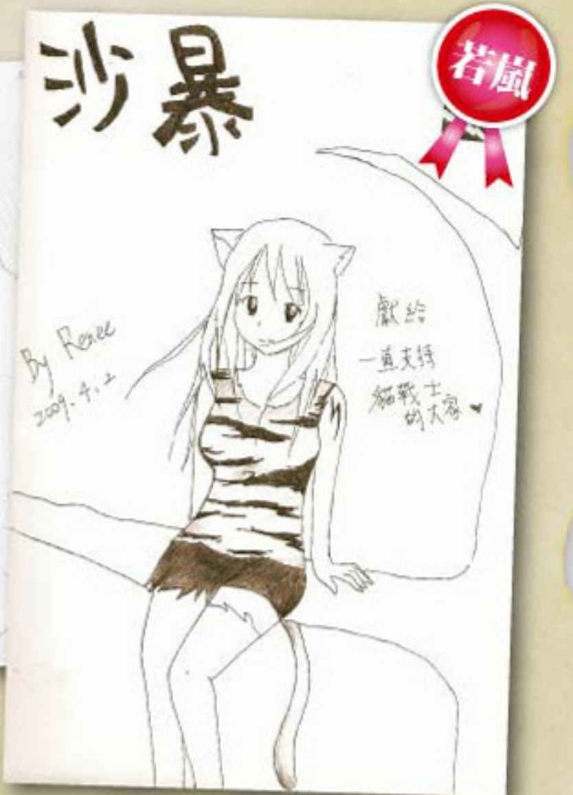
擬人化的畫法，在投稿圖中也是很受歡迎的畫風，如果貓戰士以人型來表現故事，又是另一種日系漫畫的風格吧。