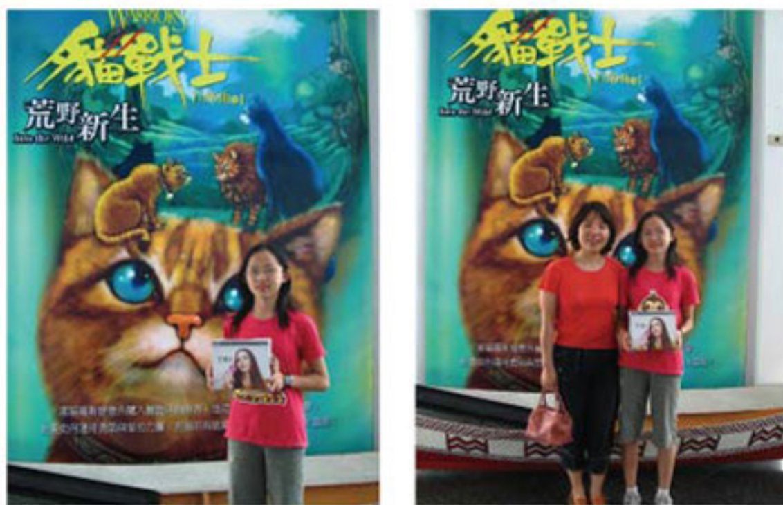
(耶！買首部曲貓戰士就抽中相機了！)