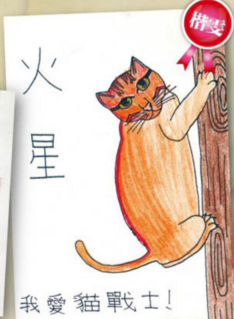
樺雯這張圖很有日本版畫的風格，在眾多插圖中獨特一格的畫風表現童趣。