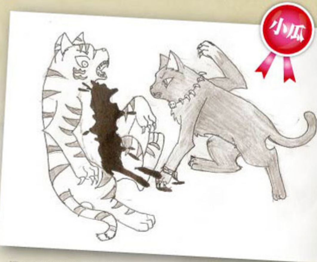
很難得有投稿是畫貓戰士打鬥的樣子，這張插圖畫得非常的傳神，把傷者震驚的表情都表達出來了。