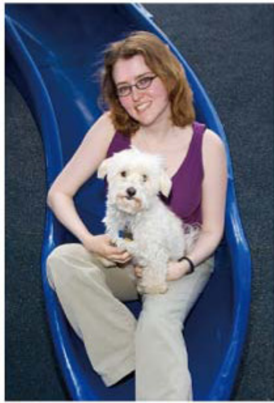
◎兒童作家崔·蘇德蘭 (Tui Sutherland)

值得特別介紹的就是崔，她是美國人，原本負責寫《追尋者》系列，後來也加入編寫貓戰士荒野手冊，例如《四族解密》、《守則解密》、《部族戰爭》都是由她完成。